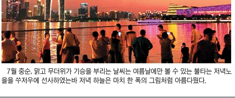
7월 중순, 맑고 무더위가 기승을 부리는 날씨는 여름날에만 볼 수 있는 볼타는 저녁노을을 수저우에 선사하였는데 저녁 하늘은 마치 한 폭의 그림처럼 아름다웠다.

중국 침략 일본군 난징대학살 수난동포기념관은 1985년 8월 15일에 건설 및 개방되었는데 난징대학살 장동면(江東門) 집단 학살 유적지와 만인갱(萬人坑) 유적지 위에 건설된 유적지형 역사박물관이다. 현재 기념관의 부지면적은 10만㎡, 건축면적은 3.5만㎡에 달하며, 전시면적은 약 1.6만㎡에 달한다. 2015년 10월 9일, 유네스코는 <난징대학살 기록>을 <세계 기억유산>에 등재한다고 선포하였다. 2017년 2월 8일, 캐나다 온타리오 주 의회는 매년 12월 13일을 온타리오 주의 난징대학살 기념일로 지정할 것을 합의하였다. 난징대학살의 역사는 도시의 기억에서 국가의 기억, 세계의 기억으로 상승하였다.