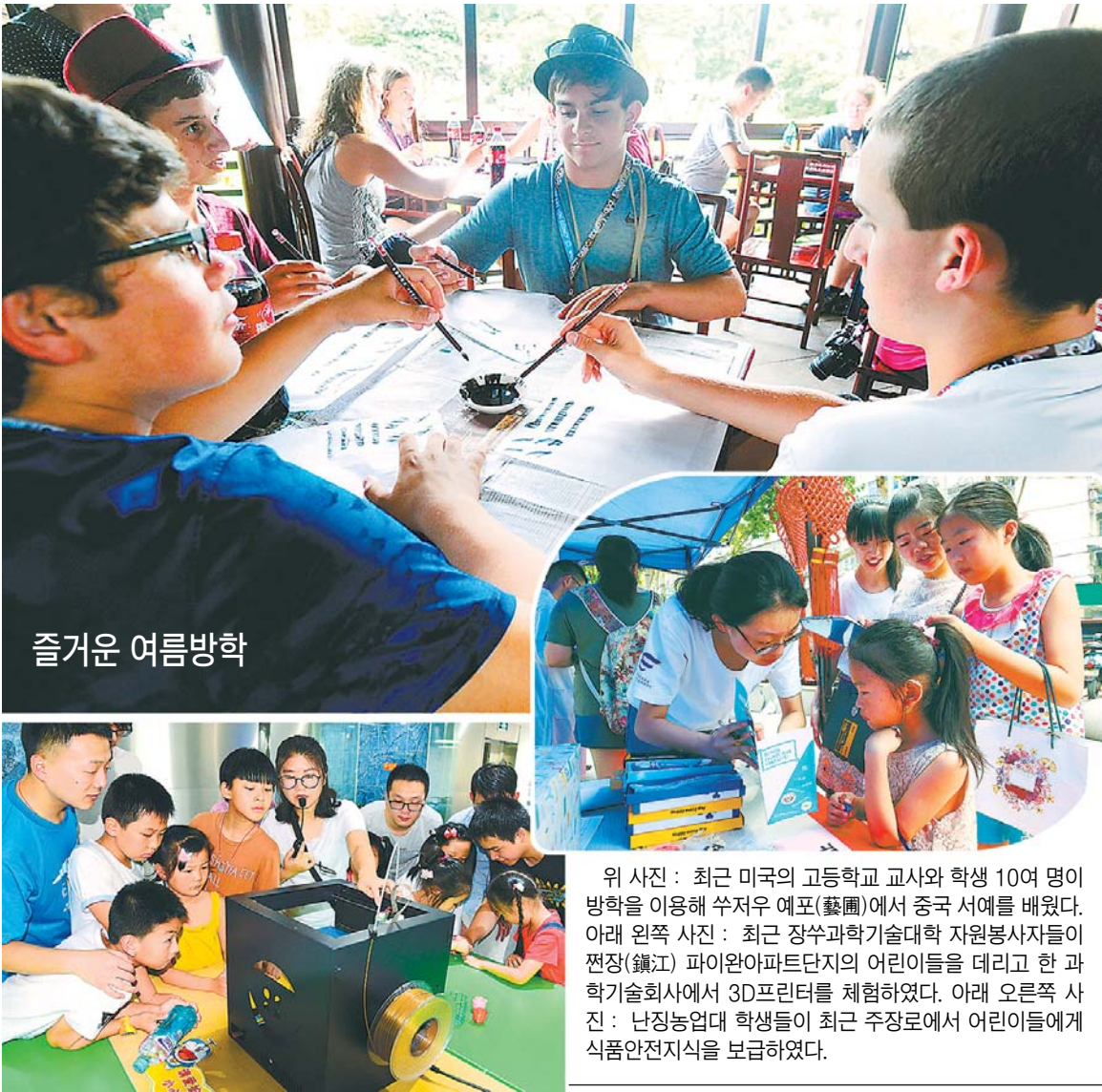
위 사진: 최근 미국의 고등학교 교사와 학생 10여 명이 방학을 이용해 수저우 예포(藝圃)에서 중국 서예를 배웠다. 아래 왼쪽 사진: 최근 장수과학기술대학 자원봉사자들이 쟈장(鑄江) 파이완아파트단지 어린이들을 데리고 한 과학기술회사에서 3D프린터를 체험하였다. 아래 오른쪽 사진: 난징농업대학 학생들이 최근 주장사에서 어린이들에게 식품안전지식을 보급하였다.

우 수출입상품 교역회를 모델로 난징 소프트웨어 박람회를 기업이 시장으로 진출하는 우수한 플랫폼으로 건설해 나갈 것입니다. 올해는 또 '온라인 소프트웨어 박람회'를 개통할 예정인데 온라인 가상 전시회를 통해 전시회의 지속성과 실효성을 보장함으로써 전시회를 꾸준히 이어나갈 것입니다."